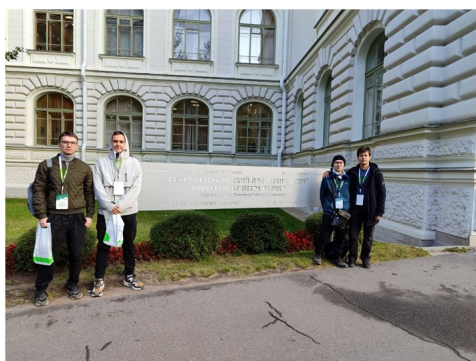
Команда ИГЭУ у политехнического университета